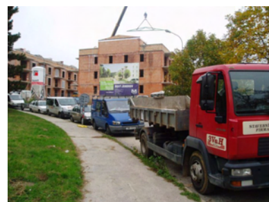
Ilustrační foto - stavba Pod Dubovou - říjen 2008

[13] 7. řádné zasedání ZMČ Brno-Jundrov 12.3.2008